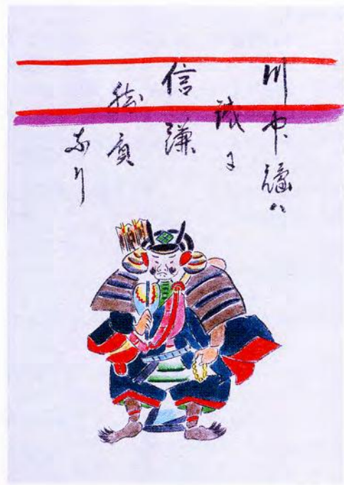
川中嶋は誠に信謙勝負なり