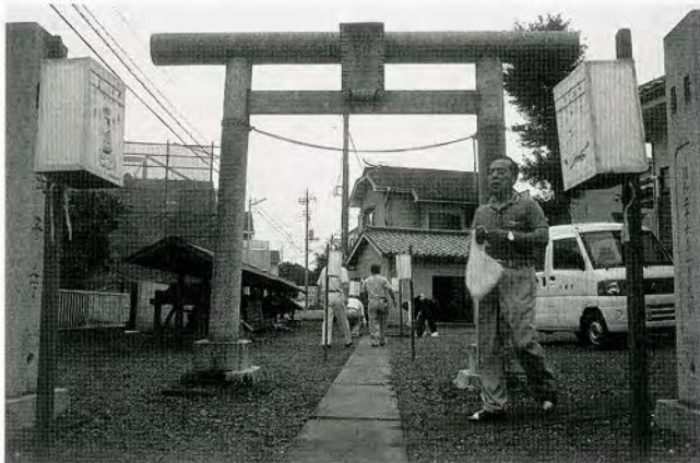
地口行灯の取り付け風景(大袋新田・弁天様)

地口絵の製作に関しては、絵心があれば誰でも描くことは可能です。明治時代、川越氷川神社の神官を務めた山田衛居が記した『朝日之舎日記』には、「終日地口之画かく」との記述があり、神社の関係者によっても描かれていたこ