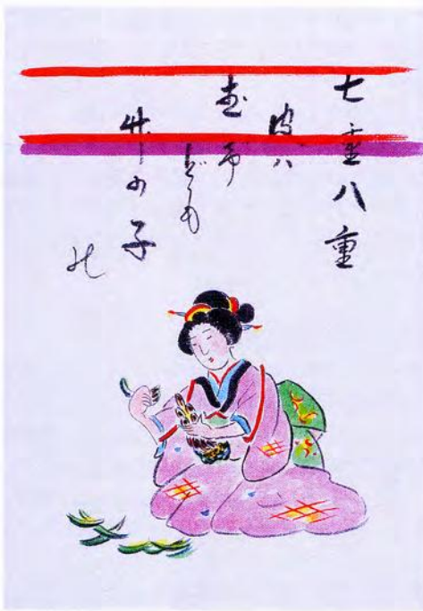
七重八重皮はむけども竹の子の