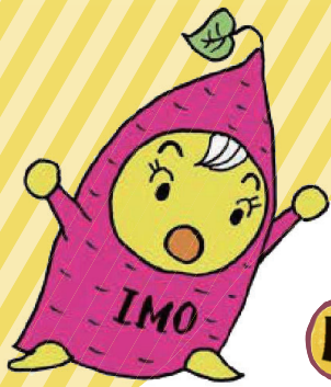
「いもっ子妖精 いもりん」 (作者 山田英次)