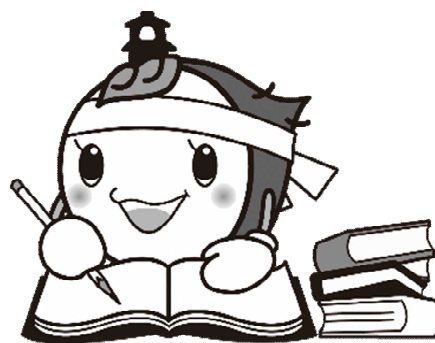
川越市マスコットキャラクター ときも

採用試験の費用には市民の皆さまの貴重な税金が使われております。 試験を申し込まれる方は 必ず受験されるよう お願いいたします。