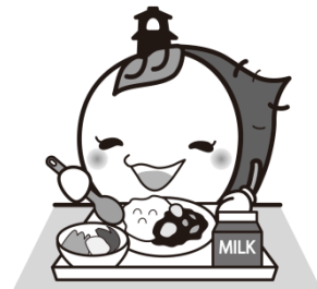
川越市マスコットキャラクターときも