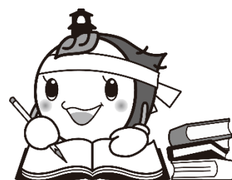
川越市マスコットキャラクターときも