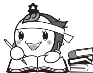
川越市マスコットキャラクター ときも

採用試験の費用には市民の皆さまの貴重な税金が使われております。 試験を申し込まれる方は 必ず受験されるよう お願いいたします。