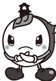
川越市マスコットキャラクター ときも

集合時刻は厳守してください。 集合時刻に遅れた場合は、 電車の遅延証明書がある場合を 除き、受験できません。