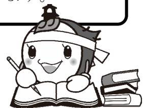
川越市マスコットキャラクター ときも

採用試験の費用には市民の皆さまの貴重な税金が使われております。試験を申し込まれる方は 必ず受験されるよう お願いいたします。