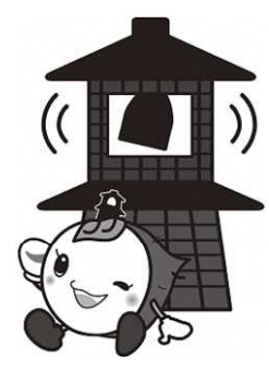
川越市マスコットキャラクター