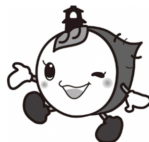
川越市マスコットキャラクター

採用試験の費用には市民の皆さまの貴重な税金が使われております。 試験を申し込まれる方は 必ず受験されるよう お願いいたします。