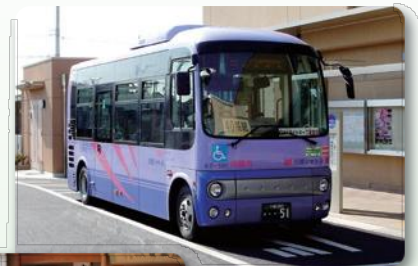
市内循環バス(川越市)