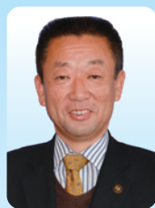
坂戸市長 石川 清