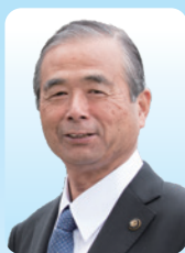
鶴ヶ島市長 齊藤 芳久