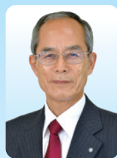
川島町長 飯島 和夫