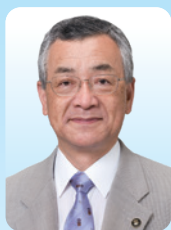
川越市長 川合 善明