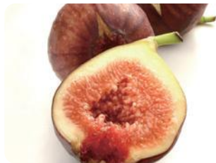
KJブランド認承品・いちじく(川島町)