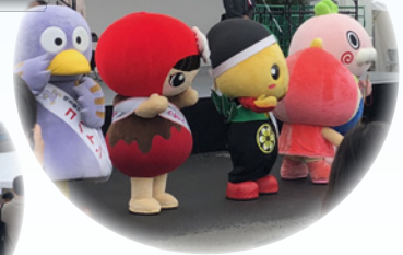
レインボーまつりin川越(川越市)