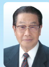
越生町長 新井 雄啓