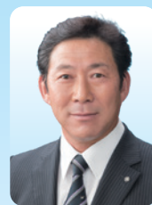
毛呂山町長 井上 健次