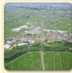
圏央道川島IC(川島町)