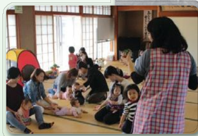
子育てサロン(川島町)