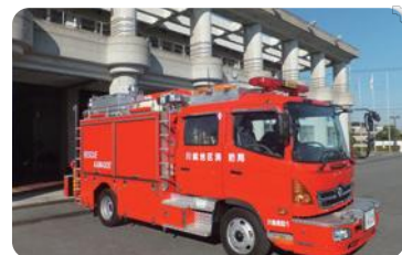
川越地区消防組合(川越市・川島町)