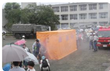
防災訓練(鶴ヶ島市)