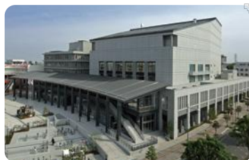
ウエスタ川越(川越市)