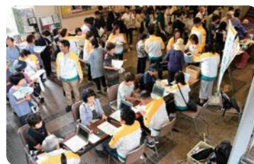
健康チェック体験(坂戸市)