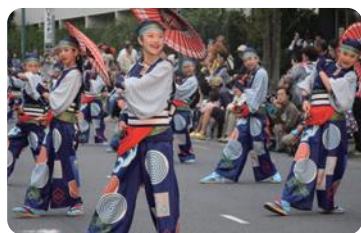
坂戸よさこい(坂戸市)