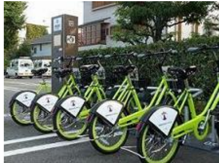
まちなかコミュニティサイクル社会実験 使用自転車とサイクルポート例