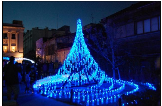
小江戸川越ライトアップ

明治の大火をくぐり抜けてきた大沢家を代表とする蔵造りの町並みは、川越を象徴する景観です。ここでは、郵便局やポスト、公共建築も蔵造りに合わせて建てられています。