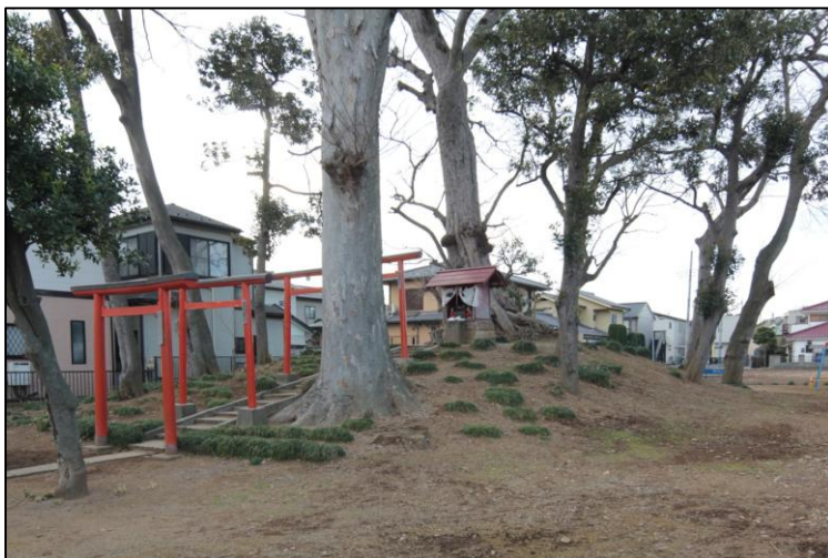
三変稲荷神社古墳

すぐ東には、樺が目印の龍池弁天が祀られており、その下からは水が湧き出ています。ここは、仙芳仙人の伝説が残ります。