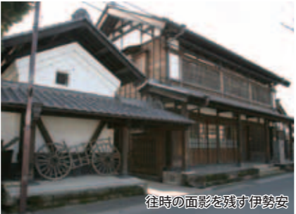
往時の面影を残す伊勢安

現在の母屋は平成11年（1999）に改築されたもので、明治3年（1870）4月の新河岸大火以降に再建された母屋と同様の外観を持ちます。帳場や民具類も当時を髣髴させます。奥には元禄期（1690年代）に建てられた素麺蔵や、文政期（1820年代）の米蔵などがあり、帆柱などの船具も残されています。