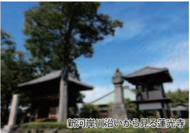
新河岸川沿いから見る蓮光寺