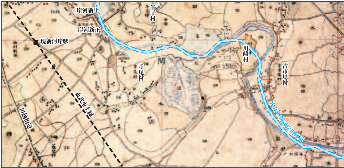
迅速測図 川越市立博物館蔵