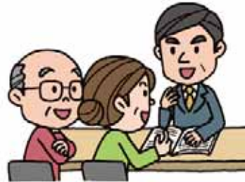
(市) 情報を提供したり、相談に応じます