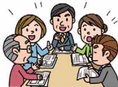
(市) 勉強会の開催を支援します