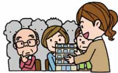
(市) 専門家を派遣して 計画づくりを支援します