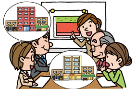
(市) 専門家を派遣して協議を支援します