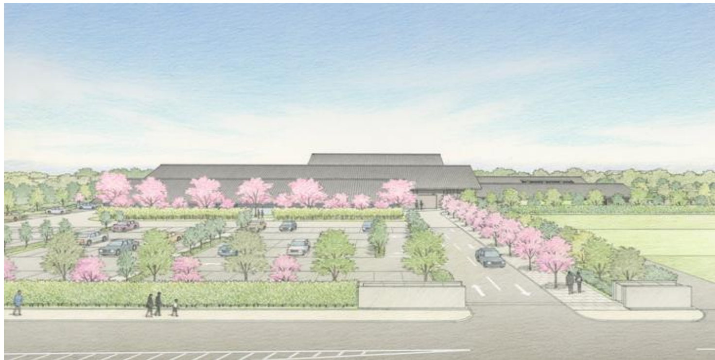
外観のイメージ（正面）