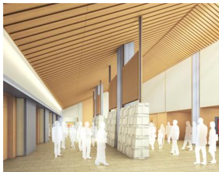
エントランスホールのイメージ