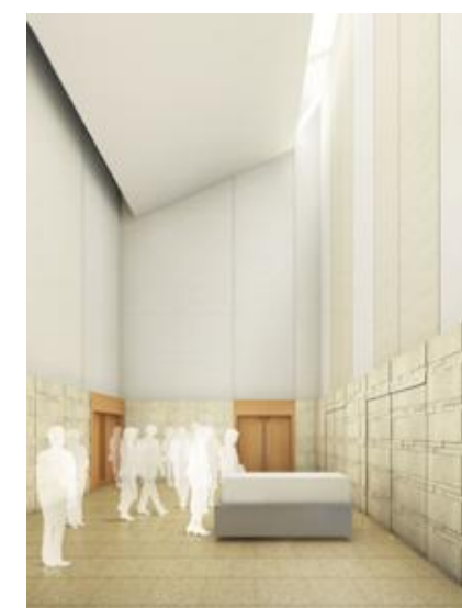
見送りホールのイメージ