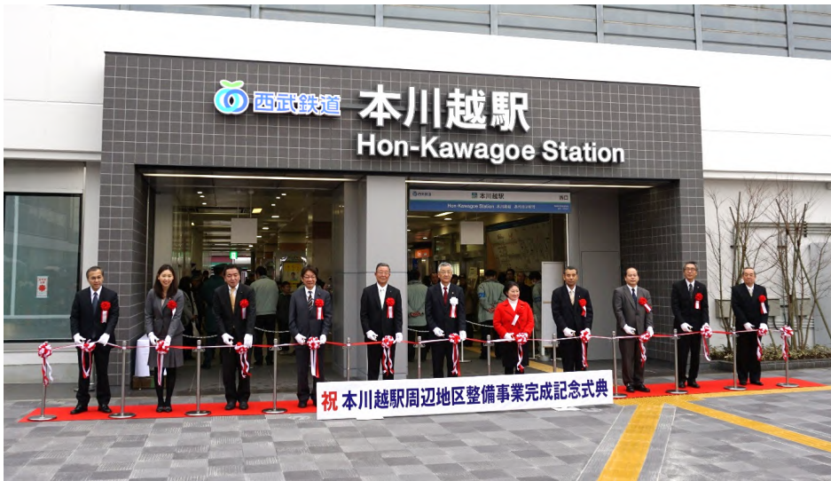
本川越駅周辺地区整備事業 完成記念式典 テープカット