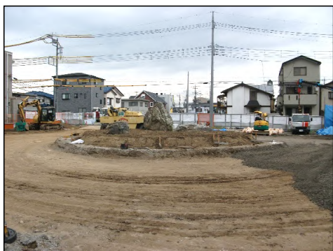
駅前広場を作っています。