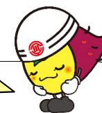
川越市マスコットキャラクター ときも

8月に工事の作業を開始してから約2ヶ月が経ちました。平成28年春の供用開始を目指して、順調に日々工事を進めています。これまでの工事の進捗状況について、下記掲載の【これまでの現場状況】にて、紹介します。