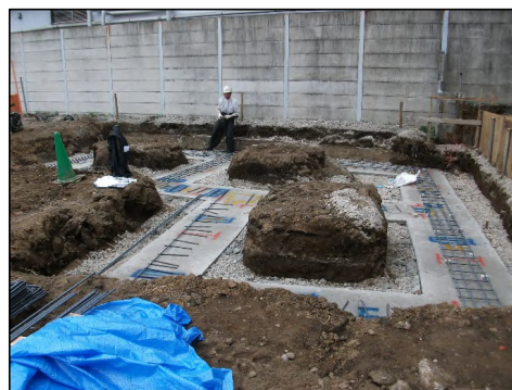
公衆トイレの基礎工事を行っています。