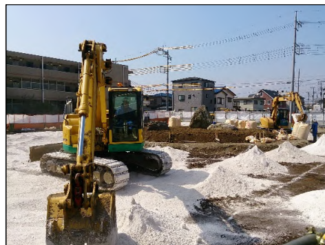
駅前広場の路床工事を行いました。