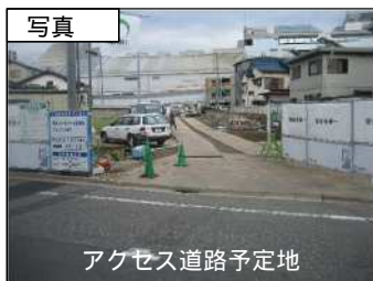
アクセス道路予定地