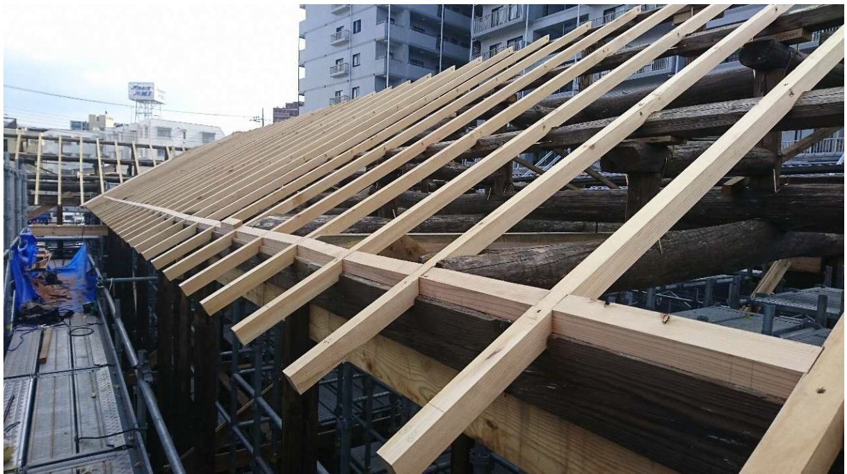
東棟屋根下地工事