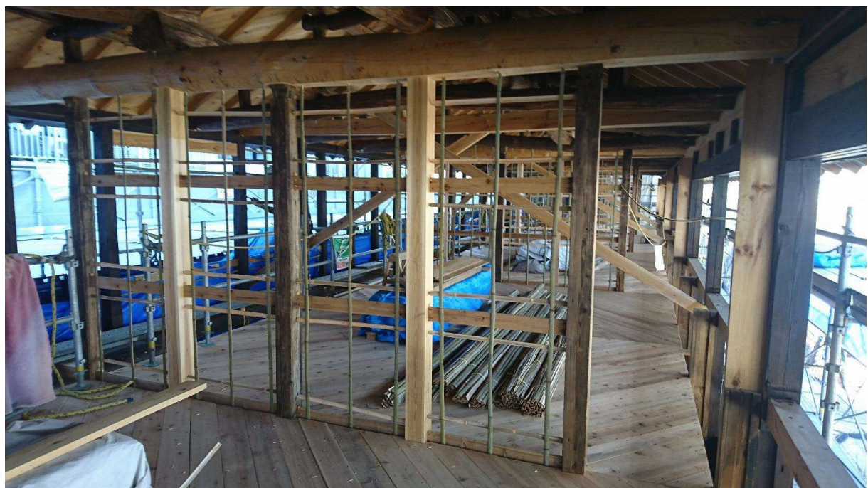
西棟2階の施工状況