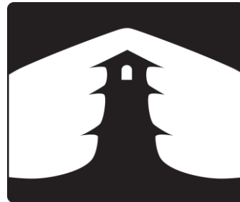
時が人を結ぶまち川越