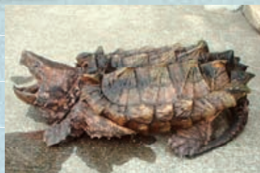
ワニガメ 最大背甲長 80cm