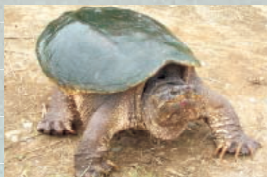
カミツキガメ 最大背甲長 50cm