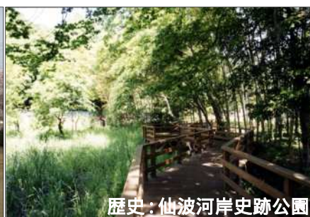
歴史：他波河岸史跡公園