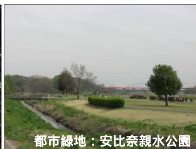
都市緑地：安比奈親水公園