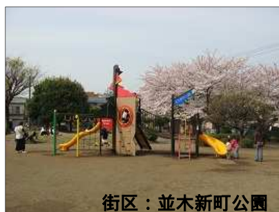
街区：並木新町公園