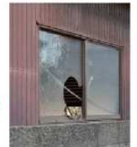
窓が割れた 管理不全空家