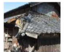
緊急代執行を要する 崩落しかけた屋根