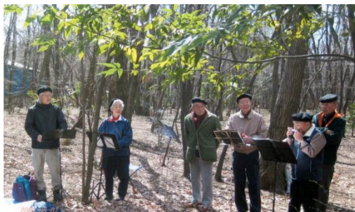
屋外（市民の森）で公演を行ったこともあります