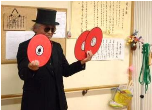
最初はすべて赤色だったレコード、いつのまにか青色や黄色に変わっていきます

「これからも、マジックを通して地域の人々とふれあい、見る人に夢と希望を与えられるような、楽しいマジックを披露していきたい」と同クラブでは考えています。