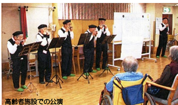
高齢者施設での公演