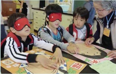
新宿フェスタ（世代間交流事業）