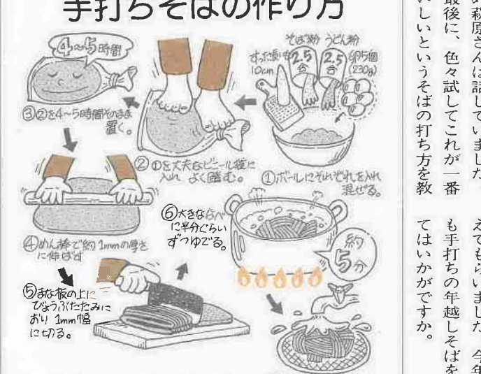
これはあくまで目安、色々試してあなたの味を楽しんでください。