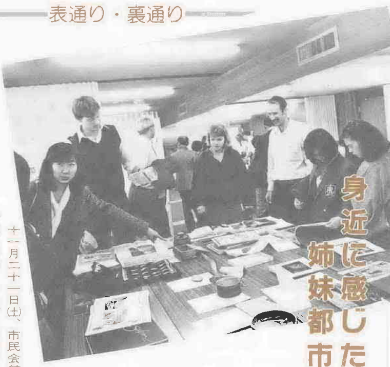
身近に感じた姉妹都市