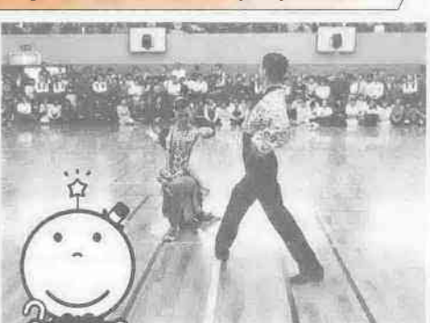
88さいたま博覧会開催記念