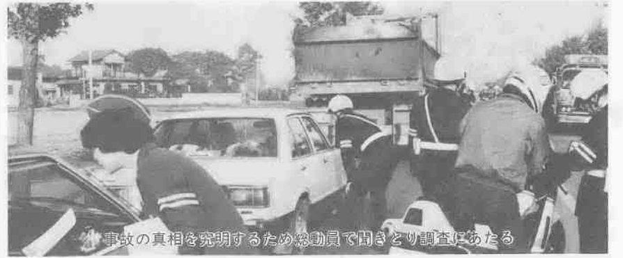
事故の真相を究明するため総動員で聞き取り調査にあたる