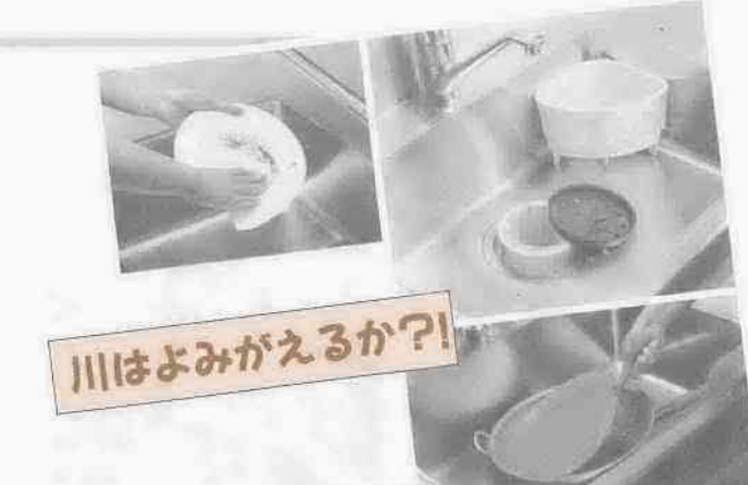
川はよみがえるか？!

したがって、清掃がめんどくさいからといって、三槽分離槽の維持管理を怠りますと、その機能が失われ、たまったゴミなどが腐敗し