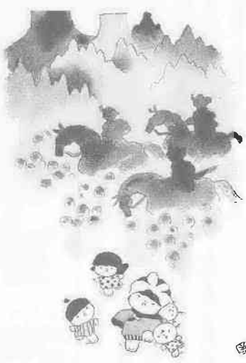
さし絵・文 池原昭治氏