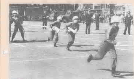
万が一に備えての女子社員の「雄姿」。

大会は動作の迅速・正確さを審査基準に三部門で行われ、結果は次のとおりです。▽男女別「屋内消火栓の部」優勝 〓男女共働写研川越工場 ▽「屋外消火栓の部」優勝 〓日清紡績(株)川越工場 ▽「小型動力ポンプの部」特別賞 〓和光純薬工業(株)東京工場 ▽「四輪ポンプ自動車」優勝 〓東洋インキ製造(株)川越支社