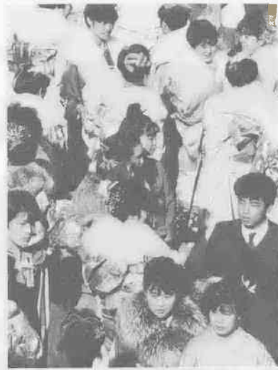
式場に集まる新成人たち(昨年)