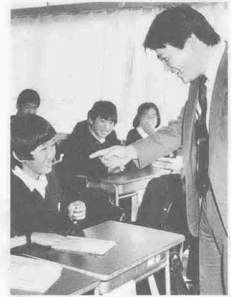
生徒理解はクラスから。生徒の立場にたっているがまを理解する努力が続く。

「生徒一人ひとりが集団のなかでよりよく適応していくためには生徒指導をどのように進めるべきか。さらに学校が社会から孤立したものでなく地域と密接につきあっているためには、どうしたらよいか。」 この研究テーマを寺尾中学校が実践するきっかけは、文部省研究校として指定される以前のいきさつがありました。 創立十一年の同校。その歴史には、新設校として「学校づくり」に励んだ時代」の次に、校内が「揺れ動いた」という経験をもっているのです。