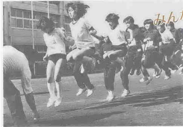
全員の協力が大切(写真と本文は関係ありません)