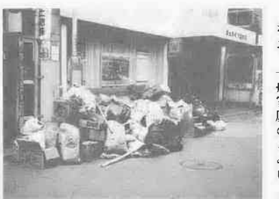
通行にも支障をきたしていた新富町通り

新富町商店会では、十月一日からごみの収集方法を改め、許可業者による夜間収集を行い、清潔で明るい町づくりに積極的に取り組んでいます。これまで新富町通りは、ごみ収