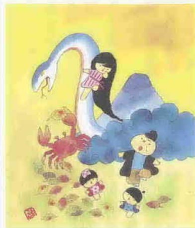
池原昭治氏 文・絵

七歳の誕生を迎えたら榛名さんにお返しするという約束をしました。あまりうれしさに次兵衛さんは月