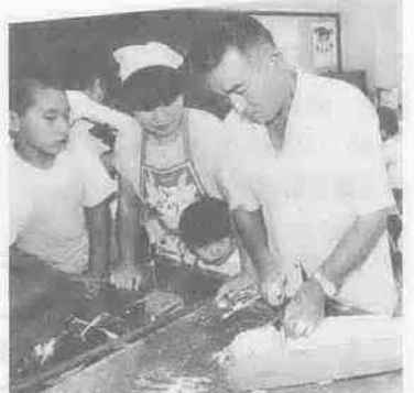
包丁さばきに視線は集中

今、市内各公民館では地域の特性を生かした内容のユニークな講座が好評。南古谷公民館では「麦づくり講座」が、八か月間をかけて終了したばかりです。 もともとこの地区は一面に広がる水田地帯でしたが、戦後、食糧増産の国策から小麦との二毛作も始めた土地柄。小麦の生産量は古谷地区に次いで二番目。今年六月には三六〇トを超えたほどです。