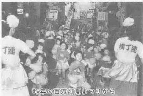
昨年の百万灯夏まつりから