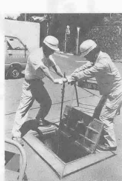
供給カットの連絡がまた入るかも知れない(県水100%供給の操作を行う)。

湧水に伴う県水の供給カットは、五月上旬から率を変えて実施されてきました。六月十六日、水道部職員を総動員して市内二百の事業所などに節水を呼びかけるステッ