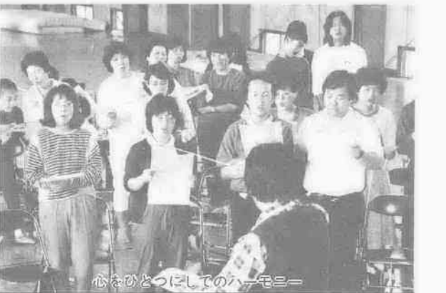
心をひとつにしてのハーモニー