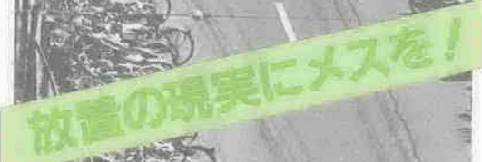
放置の現実にもス！

条例の主な内容は、次のようになっています。 まず、自転車放置による市民生活への障害を防止し、良好な生活環境を保持するため、公共の場所に自転車を放置してはならない、と明確に規定。 そのうえで、自転車利用の増加に対する受け皿づくりとして、人の出入りの多い公共施設、大型店舗などには利用者のための駐輪場設置を求め、さらに鉄道・バス会社には市が求める用地借用などに積極的に応じるよう定めています。 そして、自転車販売店には、購入者に対し住所、氏名を明記するよう、また防犯登録を受けるよう勧めたいだくこととなります。 駅から近い方は—— 自転車利用の自粛を—— 続いて、放置追放の最大のカギ