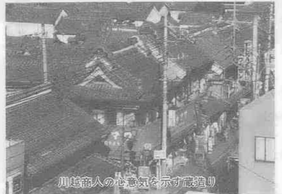
川越商人の心意気を示す蔵造り

「川越の町並み」といえば、蔵造り。時の鐘を中心とした重厚な店蔵造り群の景観に、誰しもが目を見張ります。そして、県内外から訪れる町並み探索者は後を絶ちません。 小江戸といわれる川越。その蔵造りの町並みは、明治二十六年(一八九三)三月十七日の大火後に形成されたものです。それまでの家屋は、杉皮葺、わら葺、板葺が多く、火災を受けやすい建物でした。この火災で家財を失った川越の商人は、火災に対し自力で備えなくてはならないと考え、焼けない蔵、焼けない店を造ることに資力を惜しみなく注ぎました。こうして造られたのが、「土蔵」・「店蔵」なのです。 このことは、城下町商人としての貫録と川越商人の復興の意気を示すことにもなりました。大火のあった年、すぐに蔵造りが始まったのもそのあらわれと言えましょう。こうして、大正の初め頃までに店蔵、袖蔵、塗家等々約百軒近い蔵造りの町並みが形成されたと考えられています。町内別々に蔵造りが集中したのは、現在の元町、幸町、仲町あたりですが、当時の町並みを知るには、明治三十五年の「埼玉県営業便覧」、明治四十一年の「川越町商家内寿語録」などが、大変参考になります。 蔵造りの町並みが完成し、七十有余年経た今日、時代の流れと共に開発の波にさらわれ、あるいは老朽化、また改築されるなど町並みとしての姿も変わってきました。 しかし、城下町川越の豪壮な商家が軒を並べた往時を十分にしのぶことができず。また、町並みの一角には、「蔵造り資料館」もあり、建物の構造等も知ることが出来ます。