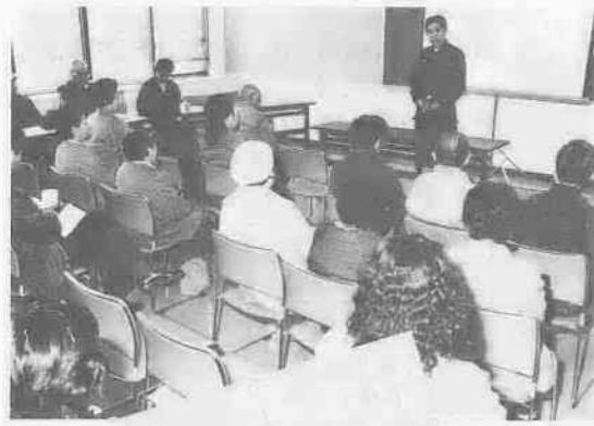
▲防火講話を聞いて、火災予防の知識を深める。

あなたの場合はどうですか？ 天ぷらを揚げる最中に、火を点けたまま電話にでたことはいですか。アイロンかけをして、最後にコンセントを抜くのを忘れたことはありませんか……。 あなたの役目は極めて重大です。消防署にできるのは、こうした火災予防の特集を組んだり、市内各地で防火教室を開催して、市民の皆さんに訴えること。火災予防を実践するのは、あくまでもあなた自身なのです。 【川越地区消防組合】