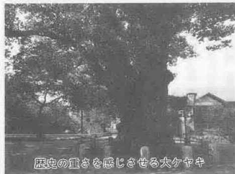
歴史の重さを感じさせる大ケヤキ

姉妹都市のたよりをお伝えするこのコーナー。今回は、福島県棚倉町の春を紹介しましょう。