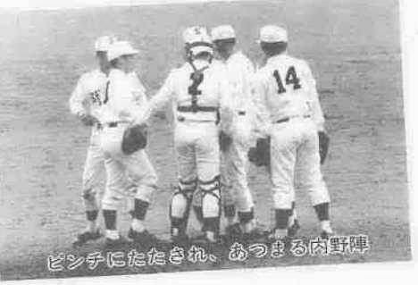
ピンチにたたされ、あつまる内野陣