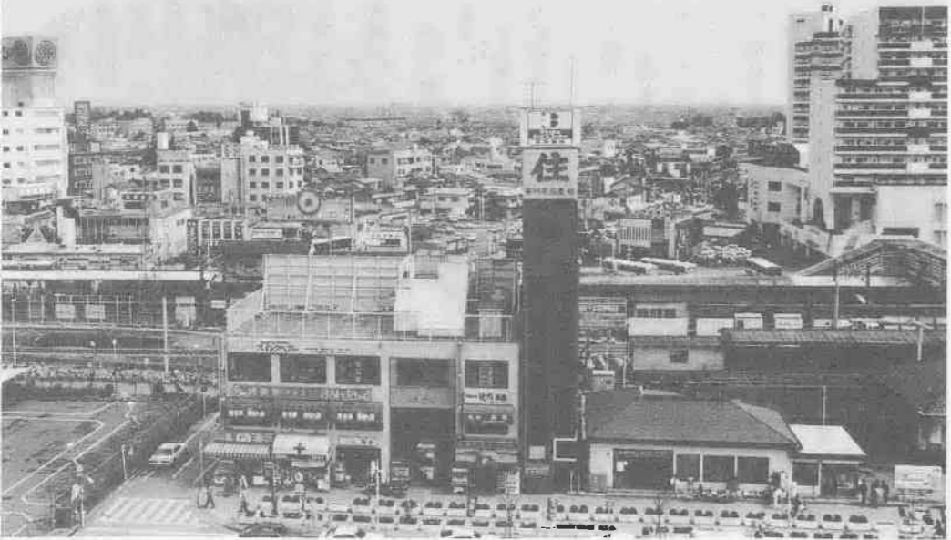
▲市街地再開発事業が行われる川越駅東口

なっております。また、特別会計予算につきましては、十一会計の総額が、二百九十九億一千四百五十万五千円となり、前年度当初予算に比べ六%の増と