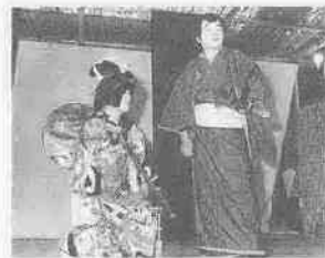
去年の出し物「日高川お半長右衛門の道行」的一幕。

個性化がすすむ現代にあつて、「いま、なぜグループ活動か?」公民館などを舞台に、仕事の傍らで、ご自分の趣味を伸ばしながら人間関係のつながりを大切にする人びとの姿をシリーズで送ります。