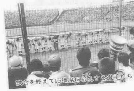
試合を終えて応援席にお礼する選手たち