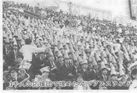
3千人の応援団で埋めたアルプススタンド

ベテラン池田高校(徳島)を相手に秀明高校が好試合を展開、小江戸川越の心意気を全国に誇示してくれた。 第五十七回選抜高校野球大会三日目の第二試合、花冷えの甲子園球場で秀明高校は池田高校と対戦。最後まで食い下がったものの、わずかに一三で惜敗した。 この日、朝五時三十分起床、六時五十分宿舎を出た秀明ナインは、甲子園近くの厚生年金グラウンドで一時間ほど練習、第二試合に備えた。強打の池田高校に初陣