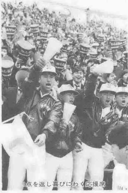
1点を返し喜びにわく応援席