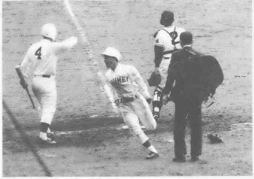
秀明は4回1死1塁、斉藤の左中間タイムリーで1点を返した

ベテラン池田高校(徳島)を相手に秀明高校が好試合を展開、小江戸川越の心意気を全国に誇示してくれた。 第五十七回選抜高校野球大会三日目の第二試合、花冷えの甲子園球場で秀明高校は池田高校と対戦。最後まで食い下がったものの、わずかに一三で惜敗した。 この日、朝五時三十分起床、六時五十分宿舎を出た秀明ナインは、甲子園近くの厚生年金グラウンドで一時間ほど練習、第二試合に備えた。強打の池田高校に初陣