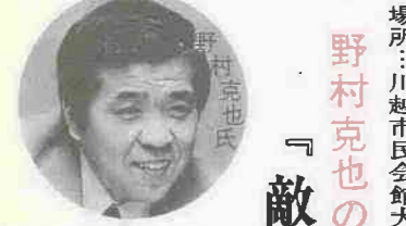
野村克也氏 『敵は我にあり』 2月24日(金)、午後2時から、川越氷川会館で開演。 主催：川越商工会議所(☎23100) ※あらかじめ電話で申し込みを。