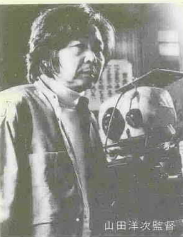
〈山田洋次監督の略歴〉 昭和6年大阪生まれ。昭和28年東京大学法学部卒。昭和29年松竹大船入社。デビューは、『二階の他人』(昭36)。大ヒットシリーズ『男はつらいよ』(昭44～58)を始め、『家族』(昭40)『故郷』(昭42)など叙情豊かな作風で知られる。

野村克也の新春講演会 『敵は我にあり』 2月24日(金)、午後2時から、川越氷川会館で開演。 主催：川越商工会議所(☎23100) ※あらかじめ電話で申し込みを。