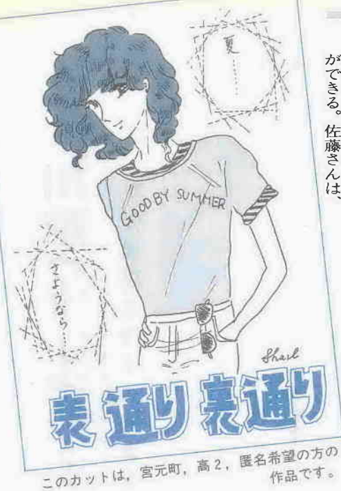
このカットは、宮元町、高2、匿名希望の方の作品です。

川越高校郷土部が、土塁を調査 した結果は、下図のようであり土 塁は、関東平野特有のローム層の 上に十層に積みあげられているこ とが判明した。同校の小泉助教諭 の話によると、