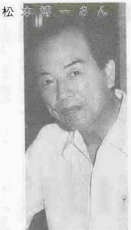
日本大学国際関係学部教授、元毎日新聞論説副主幹、モスクワ支局長ほか。