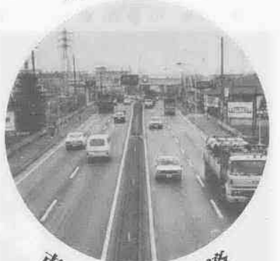
市の交通災害共済で 360円で100万円まで

いつ、どこかで、だれが会うかわからない交通事故。「絶対事故は起こさない」という気持ちでどんなに注意していても、もしも事故ということがある。市では、そんな場合に備え、交通災害共済制度を設けています。会費が不幸にして事故に会ったとき、見舞金を支給しようというこの制度。会費は一般三百六十円、中学生以下二百五十円。これだけで災害の程度に応じて、三万円から百万円まで見舞金が支給されます。万一の事故に備え、家族全員が加入しましょう。