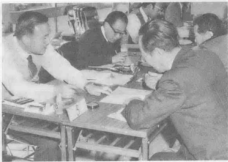
今年も市県民税の申告受付が、2月16日(火)から左表の日程で行われます。該当する方には、2月10日(木)ごろまでに申告用紙が郵送されますから、忘れずに申告しましょう。