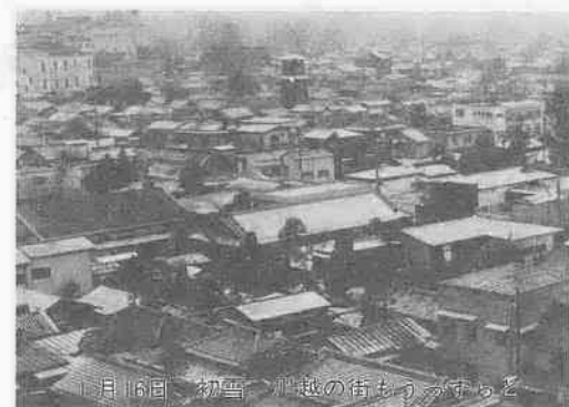
1月16日 初雪 川越の街も雪が降る