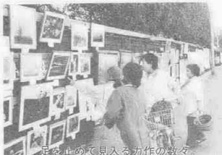
足を止めて見入る力作の数々

民家のへいを画廊に 青空美術展開かる 芸術の秋にふさわしく、高階地区を文化の香り豊かに彩る恒例の新河岸美術展が、今年も十一月三日・四日の両日、新河岸本通りを会場に開かれ、道行く人の足を止めた。