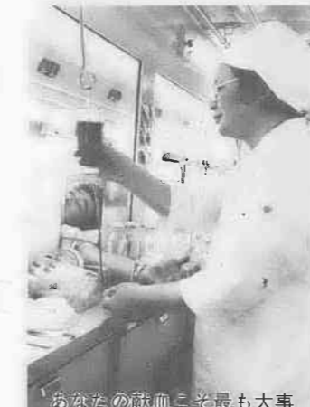
あなたの献血こそ最も大事

誰もが知っているように献血運動とは、患者がいつでも安心して輸血を受けられるよう健康な人々が無償で血液を提供するもの。不特定多数の人々のために、報酬や反対給付を期待しないで血液を提供する行為で、相互扶助の精神に立つ人道的精神であることはいまでもありません。しかしそれが、輸血を受ける際に、献血手帳を確保するため、親類縁者や友人の間を駆け回り、ときには献血手帳に高額の「プレミアム」までつく、というのが現状だとしたら――。 戦後、献血と売血の二本立てでスタートした血液事業。これが、昭和三十七年に「黄色い血」と呼ばれて輸血用血液の品質低下が医療機関から強く非難され、その後昭和三十九年からすべて献血に。献血手帳に「あなたやあなたの家族が輸血を必要とされる時、この手帳で輸血を受けられます」という記載が現われたのもこのころから。売血に代わり献血によって保存血液を確保するには、献血運動の広がりが必要だったため、献血者が輸血を受けるときは、他に優 先して献血血液を供給する、という見返り策をとっていたわけですが、月からは「供給欄」もなくなるので、この文面は削除、さらに来年四月からは「供給欄」もなくなるので、これをあらため、優先的見返り思想をあらため、手帳売買などの事態を打開しようとする。この文面は削除、さらに来年四月からは「供給欄」もなくなるので、これをあらため、優先的見返り思想をあらため、手帳売買などの事態を打開しようとする。