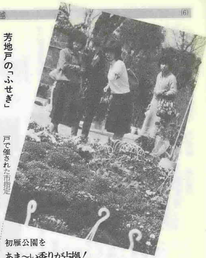
初雁公園を あま〜い香りが占拠! 3月19日から5日間、初雁公園は花と植木がかもしだすあま〜い春の香り、で満ちあふれた——これは川越市植木花き園芸組合(奥富友一会長)主催の「花と植木展示即売会」によるもので、川越に春を招く毎年恒例の催し。会場は市内の植木生産農家など26店が軒を連ね、詰めかけた家族連れ、お年寄りなどで大盛況。売り上げは昨年をはるかに上回ったとか。

表通り裏通りの主役はあなたです。「我が家・我が街・我が暮らし」を合言葉に、あなたの情報がこのページを作ります。