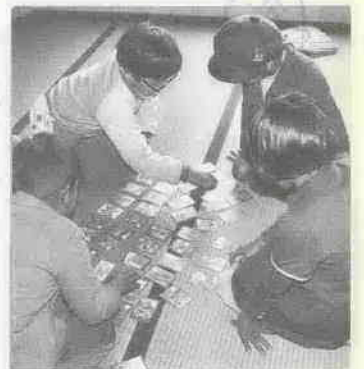
10日に行われた、文化財かるた会