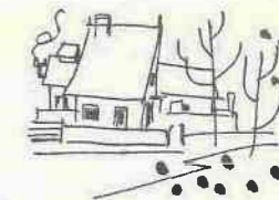
プロパンガスの取扱い