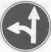
外止 指定方向通行禁止