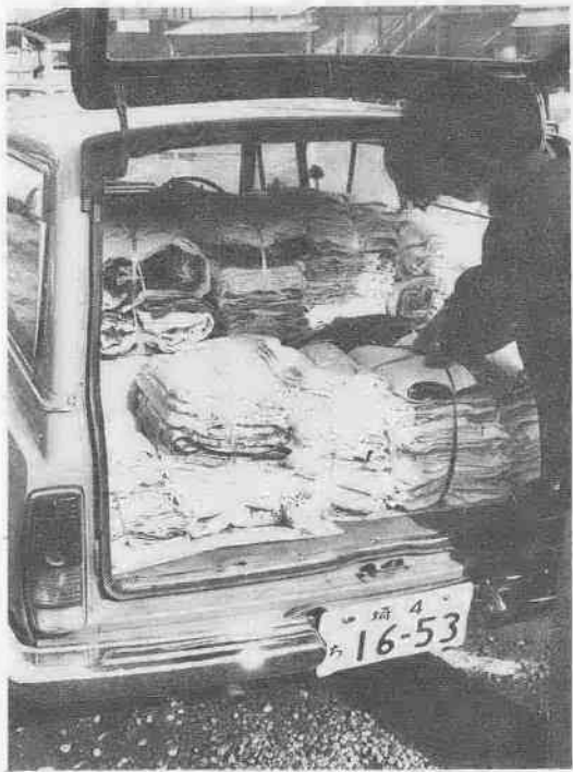
光の家へ送られる善意のオムツ