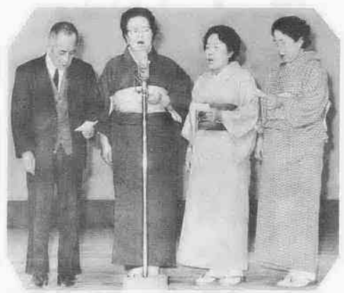
熱演する公民館利用のみなさん