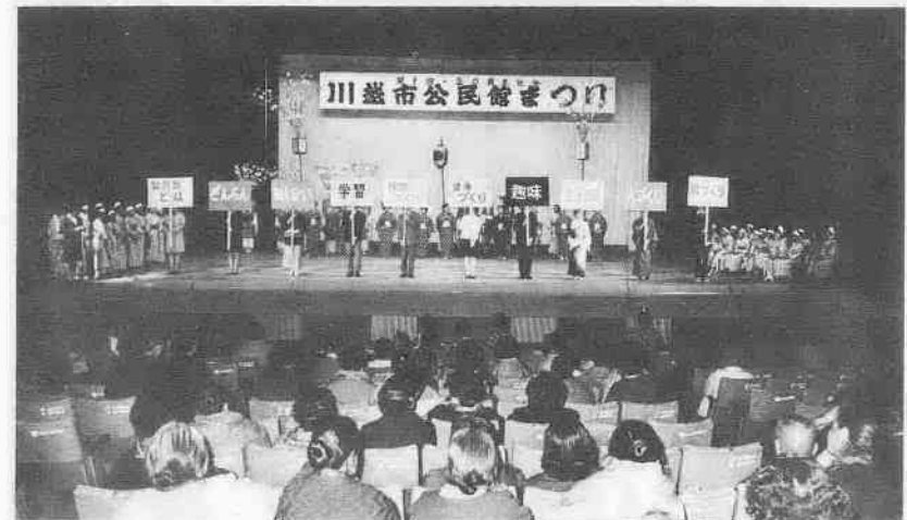
公民館の多様性をプラカードで示したフィナーレ