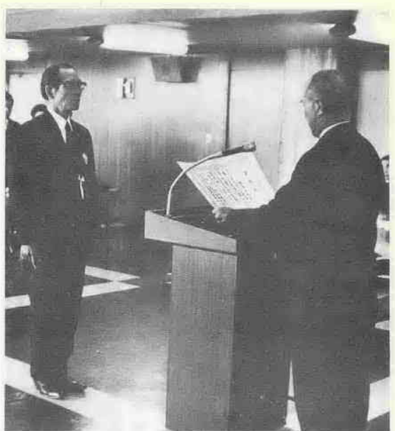
これまでの公民館活動を築いてきた45人の方々と3団体に表彰状、18人の方々に感謝状が送られました。