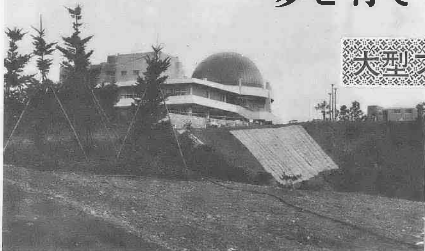
小川町に建てられた「県立少年自然の家」

昨年十月二十七日、比企郡小川町にオープンした「県立少年自然の家」は、連日県内の小・中学生などの利用客でにぎわっています。この少年自然の家は、都市化がすすむにつれて、自然に親しむ機会が少なくなった少年たちが、豊かな自然環境のなかで、将来への夢を大きくむかふようにと、県が建設したものです。