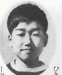
見れば見るほどこわい顔です。