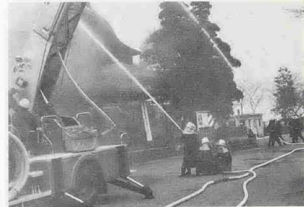
本丸御殿で防火訓練

1月25日、本丸御殿で文化財の防火訓練が行なわれました。これは、同日、開かれた文化財所有者、管理者の研修会の中で行なわれたものです。市内には文化財が多いだけに、ひとりひとりが火の取り扱いに注意したいものです。