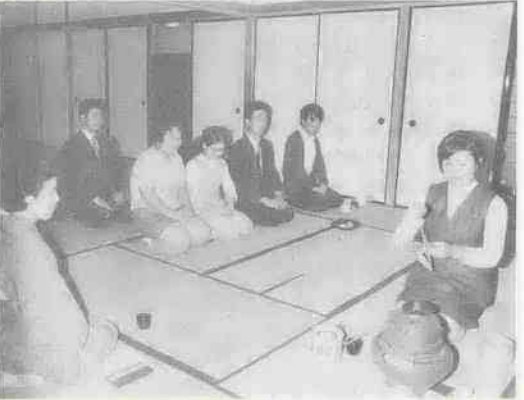
【おてまえの練習風景】