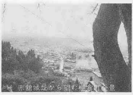
赤館城址から望む棚倉町全景

棚倉町の産業は、農業を中心としたもので、人口の約半数が農業に従事しており、産物は米を主体としていますが、特色として「こんにやく」「たばこ」などがあります。 また町の面積の七八割が山林になっていくので、木材の出荷が多く、木材も農産物に次ぐ産物にあげられています。