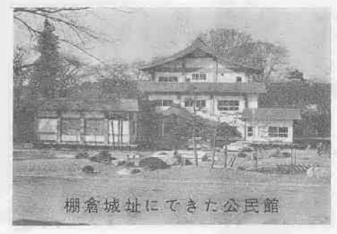
棚倉城址にできた公民館

古い歴史の町棚倉には、由緒ある史蹟や貴重な文化財が数多く町の随所に散在しています。 また自然美を誇る久慈川の清流や、美しい山並は、春秋のハイキングコースとして絶好の地として知られています。