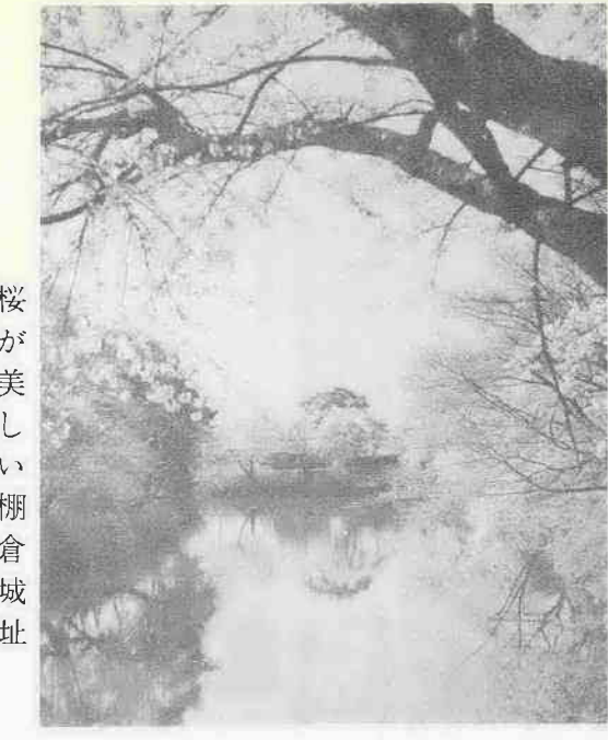
桜が美しい棚倉城址

近世初期風俗画の最大傑作といわれるこの職人尽絵は、六曲一雙の屏風で各曲に二図宛貼付されており、合わせて二十四図あります。 大きさは、各図ともタテ六十三・五センチ、ヨコ四十七・八センチで、金砂子を散らした極彩色です。 内容としては、当時の洛中洛外図にみられた諸職人を、それぞれ職能別に類集し、単独に図繪化したもので、桃山時代から江戸時代にかけてこのような尽絵は数多く製作されています。これもその一部で、とくに労働にいそむ職人の仕事場風景が描かれ、当時の庶民生活を知る上で大切な資料となっています。 筆者は狩野派に所属した画家で狩野元信の弟である之信の孫にあたり、狩野吉信といわれ、号を昌庵と称し寛永十一年(一六四〇年)八十九歳で歿しています。 描かれている職人の種別は、仏師、傘師、革師、鋳師、経師、糸師、形置師、筆師、扇師、櫛物師、研師、弓師、珠数師、鍛冶師、機織師、刀師、蒔絵師、向躰師、番匠師、畳師、桶師、縫取師、こけつ師(くりりぞめ)、薬細工師、矢細工師の合計二十五職です。 現在、実物は県立博物館(大宮市)に、模写したものは喜多院にあります。