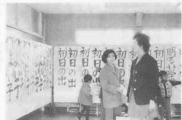
霞北公民館で書初展

4月に入学するこどもたちの健康診断が1月22日の川越小をかきりに各校で行なわれました。こどもたちは、みなれないおともだちの顔もあつてか、期待と不安のまじった表情で、診断を受けていました。