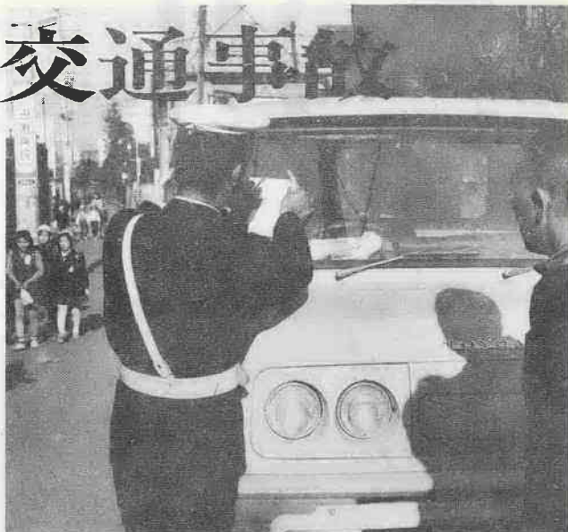
違法駐車を取締る警察官