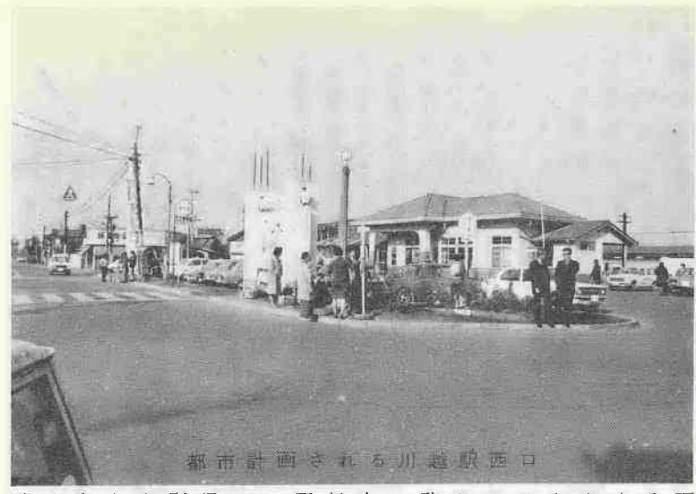
西口越川市街に計画する

市議会第七回定例会において、議決された、各会計の補正予算の内容は、つぎのとおりです。 ▽昭和四十五年度埼玉県川越市一般会計補正予算(第三号) は、市一般会計予算の補正でありまして、歳入・歳出ともに、一億六千五百万円を補正し、総額で五十一億二千五百二十三万円とす