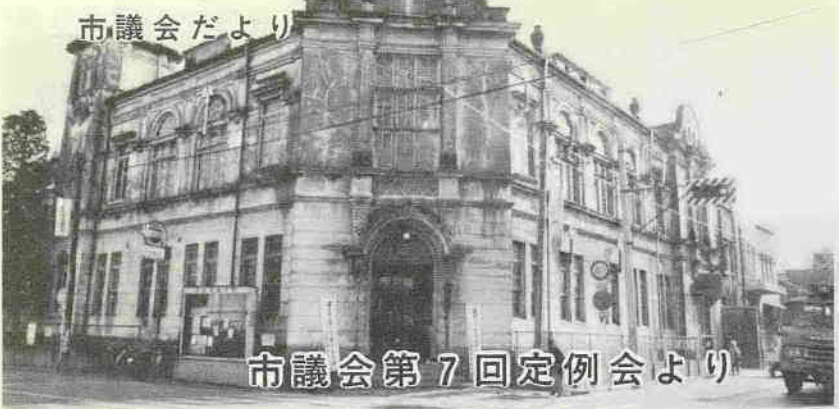
市議会第7回定例会より

最終日(十二月十六日)は、請願四件を採択、議案二十七件を原案可決、ついて、教育委員会委員、固定資産評価審査委員会委員を選任し、意見書一件を可決し、閉会。