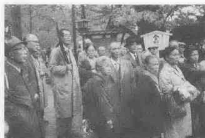
〈日光見物をする通町第一百年会の老人たち〉