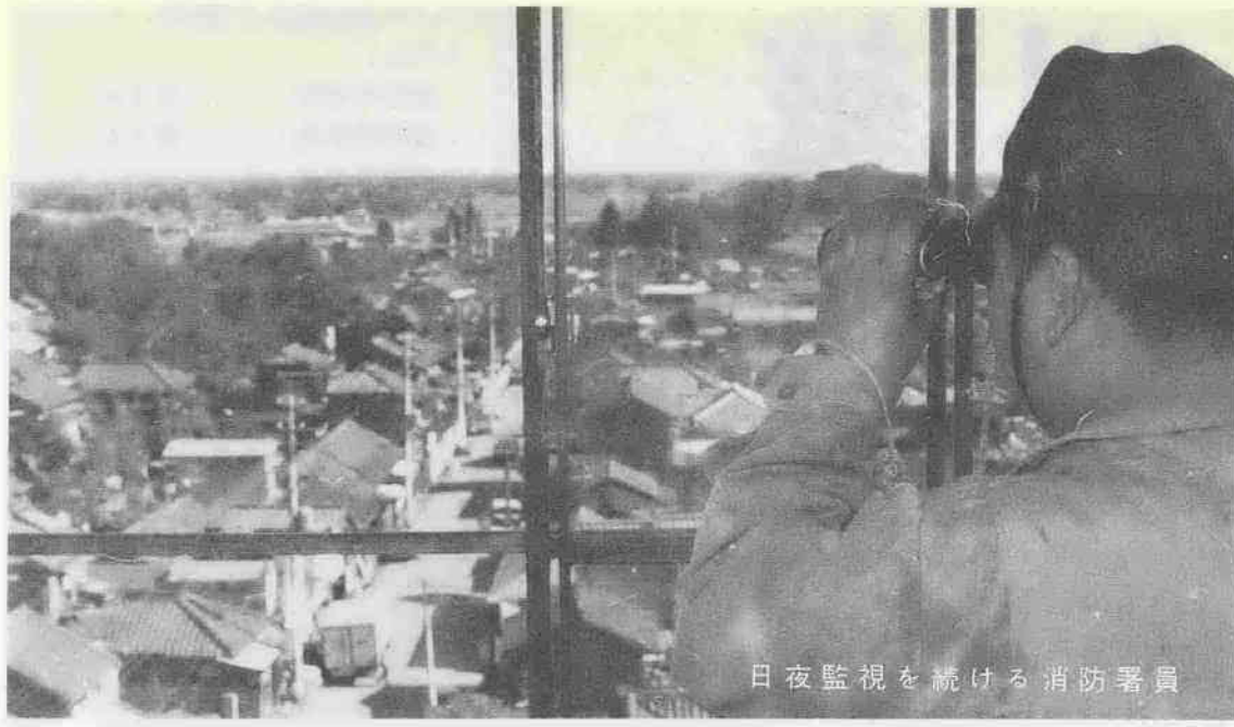
日夜監視を続ける消防署員

本年は、あぶない。消し忘れ切り忘れを全国の統一スローガンとして、国民ひとりひとりの防火意識の向上を図り、火災の発生防止と人命損傷事故の絶滅を目的に、この運動を展開してまいります。