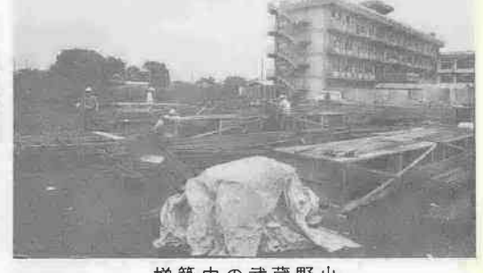
増築中の武蔵野小