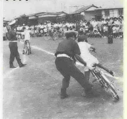
〈霞ヶ関北小学校の交通安全教室〉

夏の交通安全運動が、七月二十日から県下いっせいにくりひろげられています。ことしの運動は前期（七月二十二日）七月三十一日）と、後期（八月二十二日）八月三十一日）にわけて、通行上弱い立場にある歩行者、とくに子どもと老人の交通事故絶滅を中心目標として行なわれています。 夏は、暑さや夏休みという生活環境の変化にともなう、例年こどもの交通事故が多くなっています。そこで、今回の運動は、次のことを運動目標にかかげ、いたましい交通事故を防止しようとするものです。