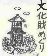
連馨寺の銅鐘 (工芸品)

文化財めぐり れんけい寺の釣鐘は、長さ五尺八寸(一七五センチ)、径三尺(九一センチ)、重さ約二八〇貫(一、〇四八トン)で川越第一の大鐘として有名である。 柳沢吉保が川越城主だった元禄八年(一六九五)に、井上源清、山東小市郎が奉行となり、木村将監が鋳造された。銘文に「山田庄三吉郷河越邑」の文字がみえる。