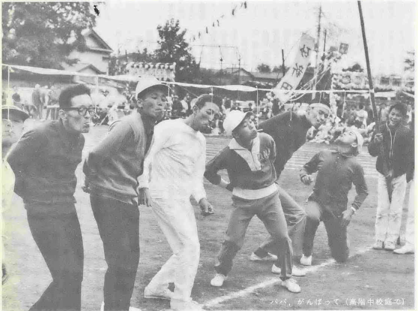
パパ、がんばって (高階中校庭で)