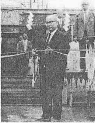
【写真上は霞ヶ関小、中下は同校のプール完成式の様子】

市民のみなさまにご利用いただくに充実に、みなさんの希望に添うよう、従来の社会福祉事務所と菅原町公民館で、月二回ずつ実施しておりました心配ごと相談を、市役所の市民相談室内で取り扱うことになり、毎日相談員が、他の相談ごととあわせて、相談に当たることになりました。また、月一回行なっていました、内職相談においても、引き続き行ないますので、お気軽に市役所受付へおいでください。